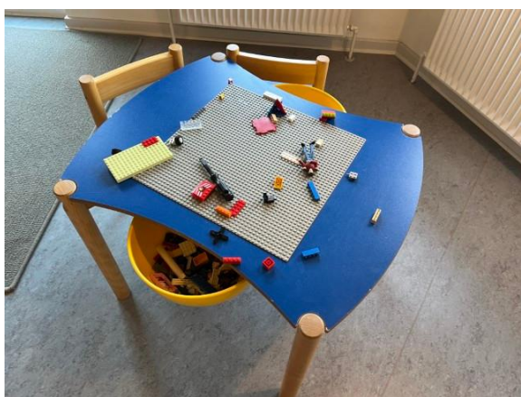
Foto 6 - lege og læringsmiljøer