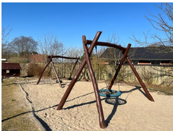
Foto 8 - legeplads