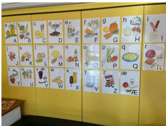
Foto 5 - lege og læringsmiljø