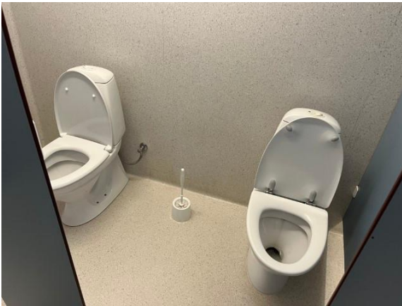
Foto 2 - garderobe